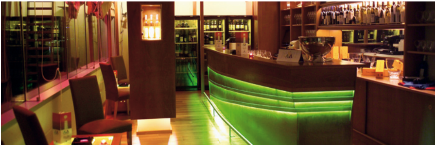
LED-Betriebsgeräte von OSRAM lassen sich sicher und installationsfreundlich in die jeweilige Anwendung integrieren.