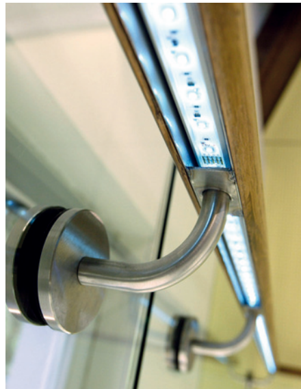
LED-Konverter von OSRAM erfüllen bereits jetzt die neuen Normen und sorgen damit für mehr Sicherheit.

Diese Norm definiert ein optimal abgestimmtes Zusammenspiel zwischen Betriebsgerät und LED. Die Arbeitsweisenorm stellt die Einhaltung der LED-Betriebsparameter sicher und optimiert somit die Lebensdauer des Systems.