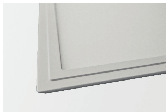
Abb. 2: LED Panel Gemma, Detail Rahmenprofil