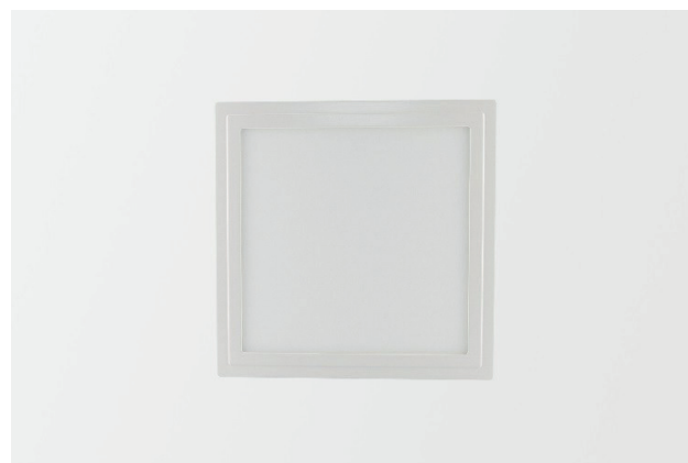
Abb. 1: Lumego Gemma LED-Panel, weiß 31,8 x 31,8 cm

Alle weiteren technischen Merkmale und Daten bezüglich des LED Panels Gemma wie Treiber und Zubehör sind dem jeweiligen Datenblatt zu entnehmen und nach Bauabschluss in der Baudokumentation zusammen mit der jeweiligen Installations- und Betriebsanleitung zu hinterlegen.