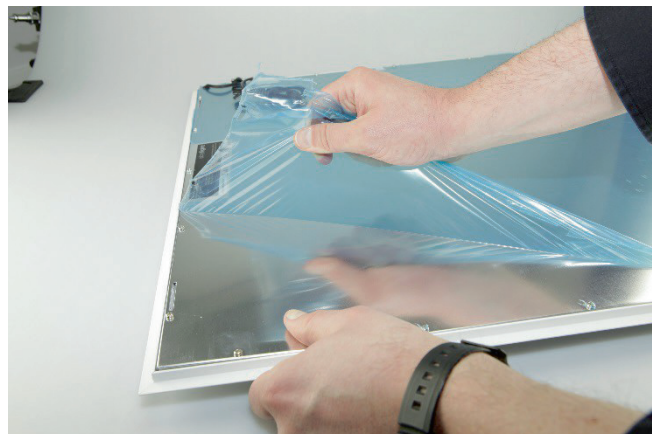
Abb. 6: Entfernen der Schutzfolie

Technische Änderungen sind vorbehalten. Vergewissern Sie sich, dass Sie immer den neuesten Stand der Informationen verwenden. Aktuelle Informationen finden Sie unter www.leds.de .