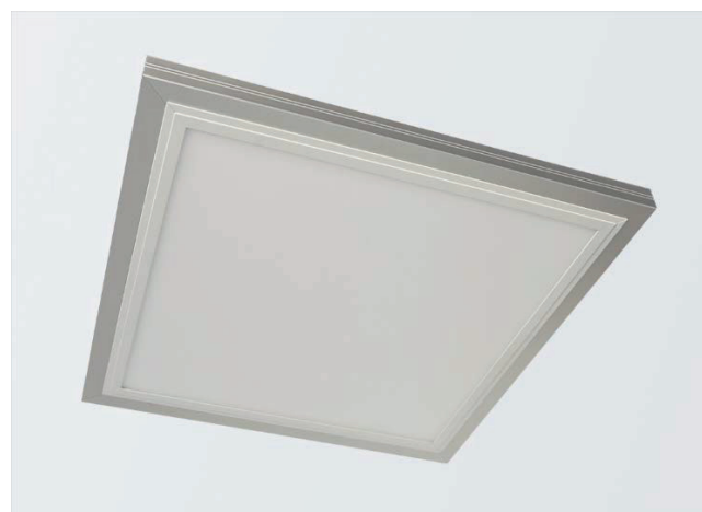
Abb. 3: LED Panel Gemma, weiß 31,8 x 31,8 cm im Aufbau-Montagerahmen